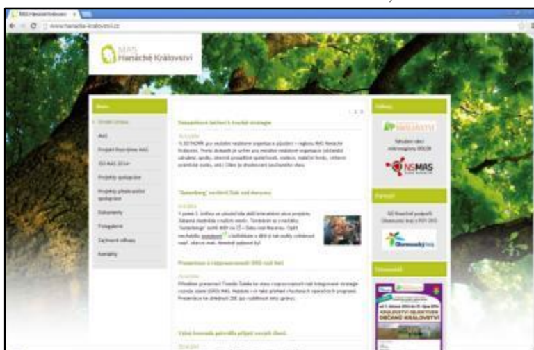
Obrázek 1 - Nové webové stránky MAS