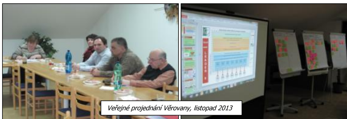
Veřejné projednání Věrovany, listopad 2013