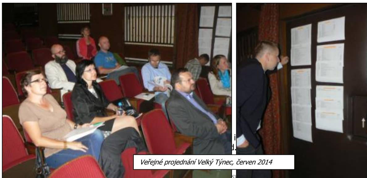
Obrázek 4 - Fotografie z veřejného projednání

Byla představena verze strategie před dokončením – analytická i strategická část. Diskutovaly se především prioritní oblasti a opatření ve strategické části ISRÚ.