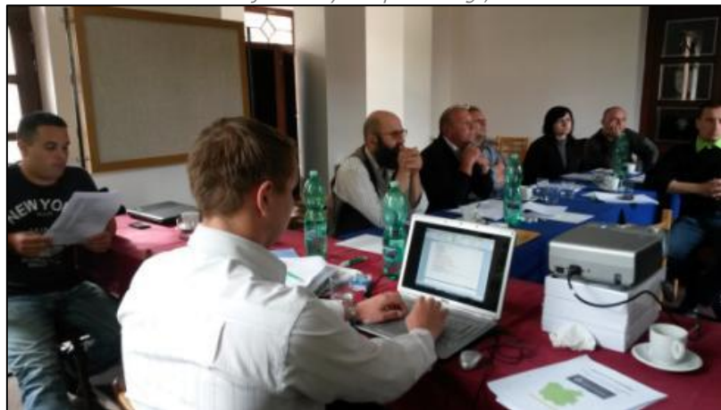
Obrázek 6 - Foto z jednání výboru pro strategii, květen 2014