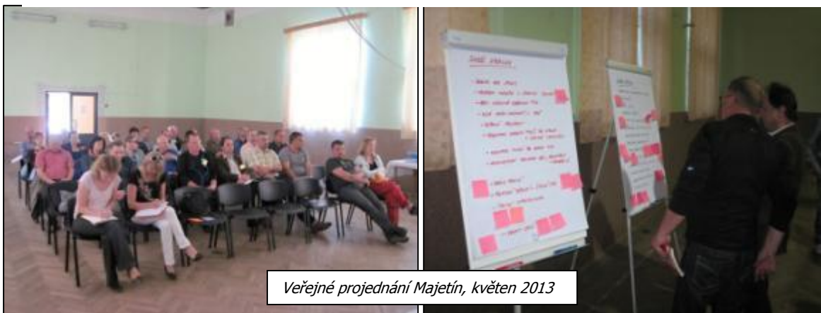
Veřejné projednání Majetín, květen 2013