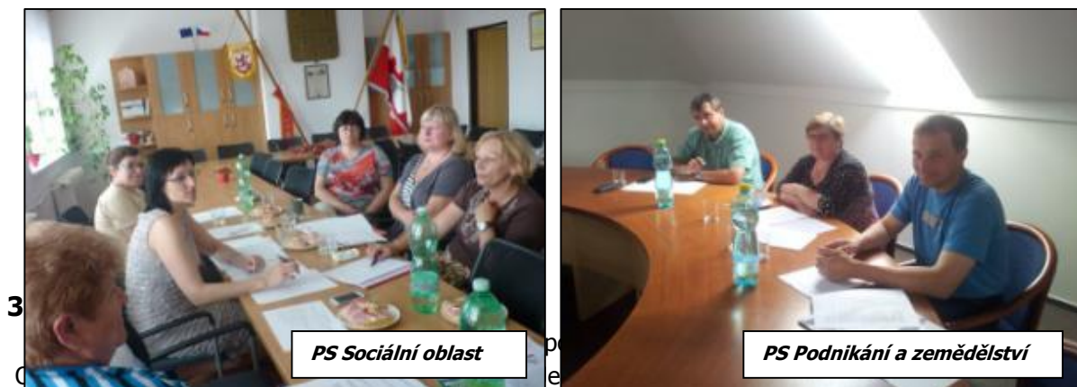
Obrázek 7 - Tematické pracovní skupiny

Výstupy pracovních skupin jsou použity do analytické i strategické části ISRÚ.